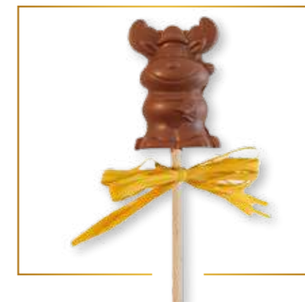
Chocolat lait renne 18g x 20 - S002