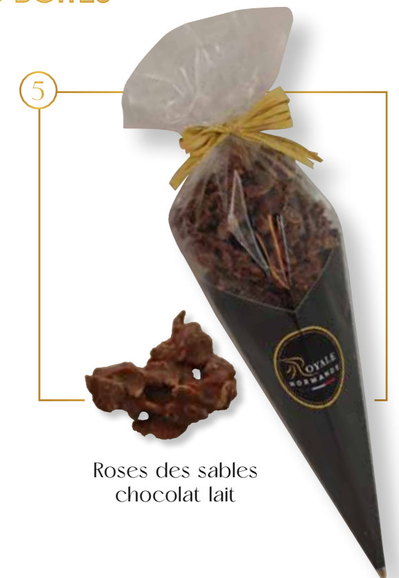
Roses des sables chocolat lait