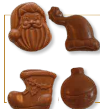
Fritures feuilletine croustillante chocolat lait 4 sujets assortis 2kg - 561L