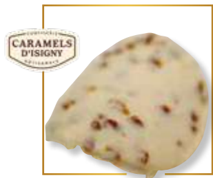
Éclats de caramel d'Isigny 319B