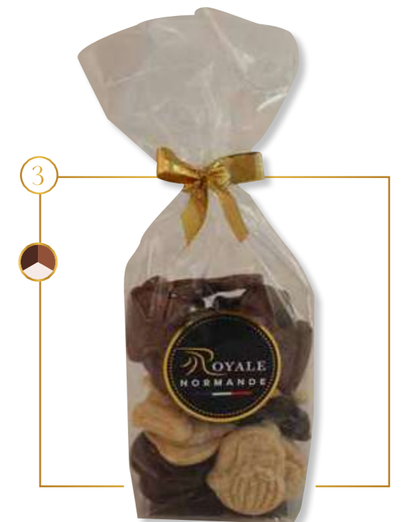
Assortiment fritures de Noël feuilletine crouillante

1 ASSORTIMENT FRITURES DE NOËL Assortiment noir, lait, blanc Sachet 150g x 12 - 560AS1 CC