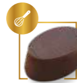
Thé fondant 142