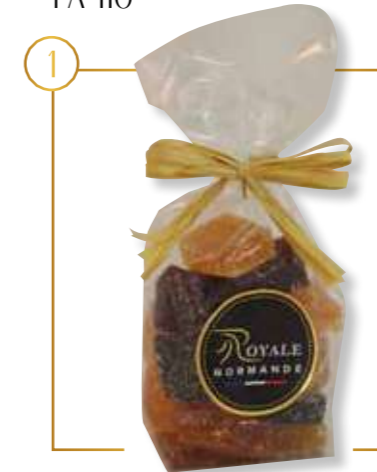
Sachet assortiment 3 parfums