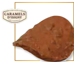
Éclats de caramel d'Isigny 319L