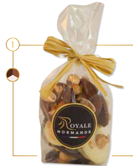
Assortiment lait, noir, blanc