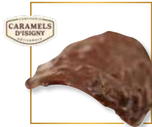
Éclats de caramel d'Isigny 319N