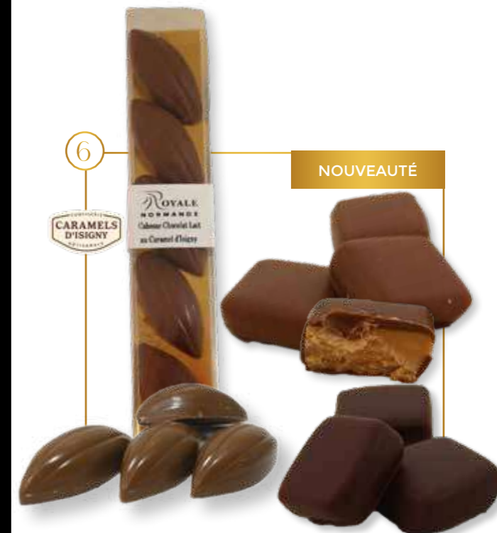
Caramel d'Isigny enrobé/ fourré

NOUVEAUTÉ Fondant caramel d'Isigny beurre salé & chocolat noir Vrac - Carton 1,3kg - 133 Vrac - Carton 5kg - 133PP2 Fondant vanille & chocolat lait Vrac - Carton 1,3kg - 134 Vrac - Carton 5kg - 134PP2 Cabosse au caramel d'Isigny & chocolat lait Vrac - Carton 1,4kg - 311 Réglette cabosse au caramel d'Isigny & chocolat lait 50g x 24 - 311R1