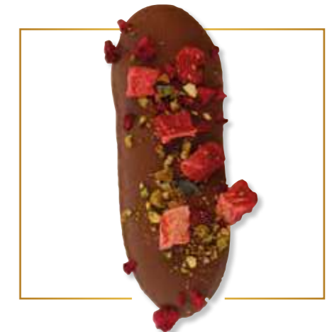
Chocolat lait & inclusions fruits 190L