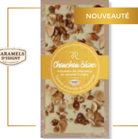
Chocolat blanc & inclusions de chouchous au caramel d'Isigny 110g – x 12 – PP248