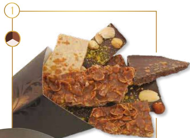
Bouquet de chocolats