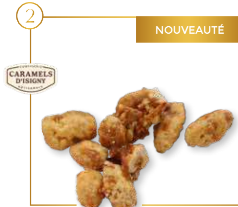
Chouchous au caramel d'Isigny