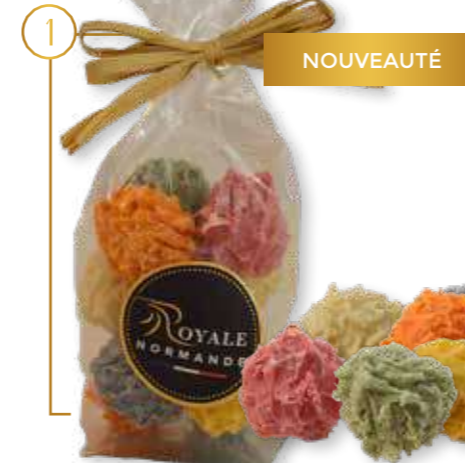
Chardons chocolat & alcool