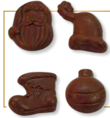
Chocolat lait 4 sujets assortis 2kg - 560L 8kg - 560LPP2