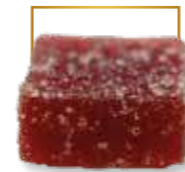
Framboise* PA 101

VRAC, SACHETS, COFFRETS, RÉGLETTES & CORNETS