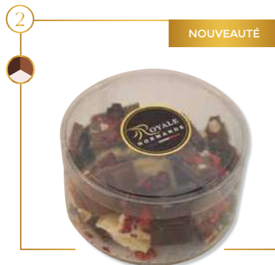
Boîte baby carrés de tablettes gourmandes