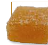
Poire* PA 103