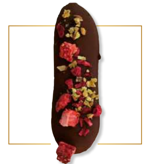
Chocolat noir & inclusions fruits 190N