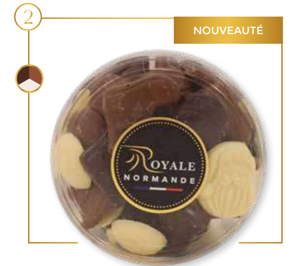
Boîte baby fritures de Noël