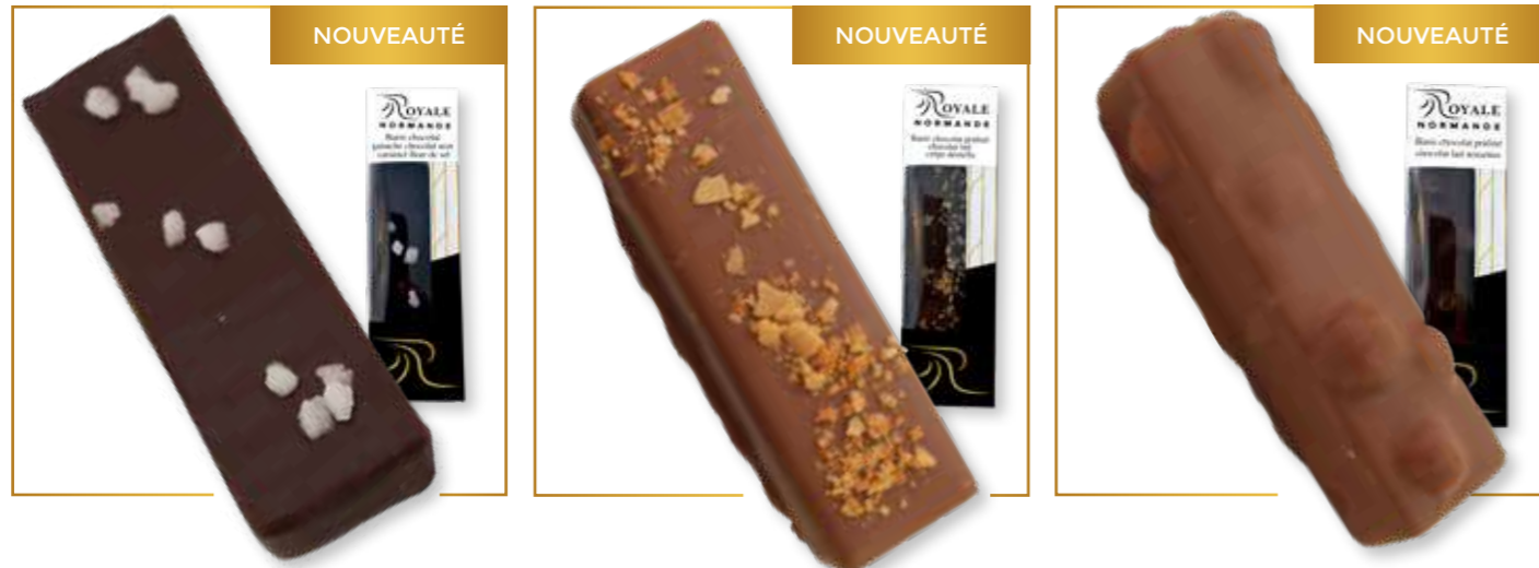
Barre chocolat ganache chocolat noir caramel fleur de sel 40g x 24 – 345