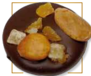
Chocolat noir* 701N