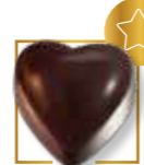
Cœur noir intense NOUVEAUTÉ 312N