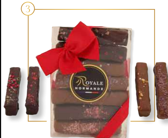
Guimauves bâtonnets décorés

Vrac enrobées chocolat lait - Carton 0,80kg - 139L3 Vrac Enrobées chocolat noir - Carton 0,80kg - 139N3 Coffret 140g x 7 - 139AC3