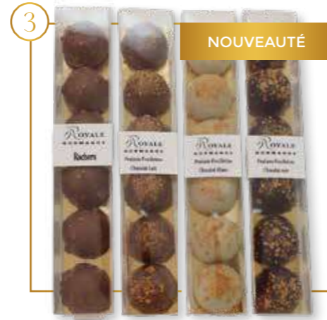
Réglette 6 rochers/domes