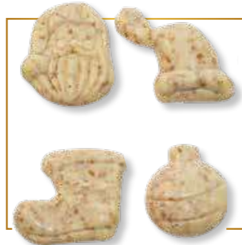
Fritures feuilletine croustillante chocolat blanc 4 sujets assortis 2 kg - 561B