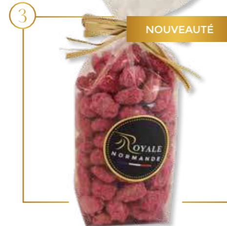
Pralines amande roses