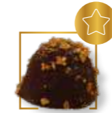
Dome praliné feuilletine NOUVEAUTÉ 105N2