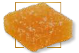
Mandarine* PA 108