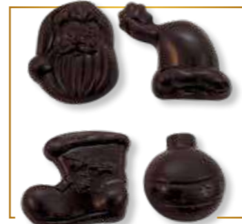
Chocolat noir 4 sujets assortis 2kg - 560N 8kg - 560NPP2