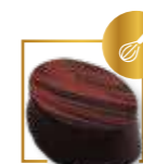
Caramel framboise 228