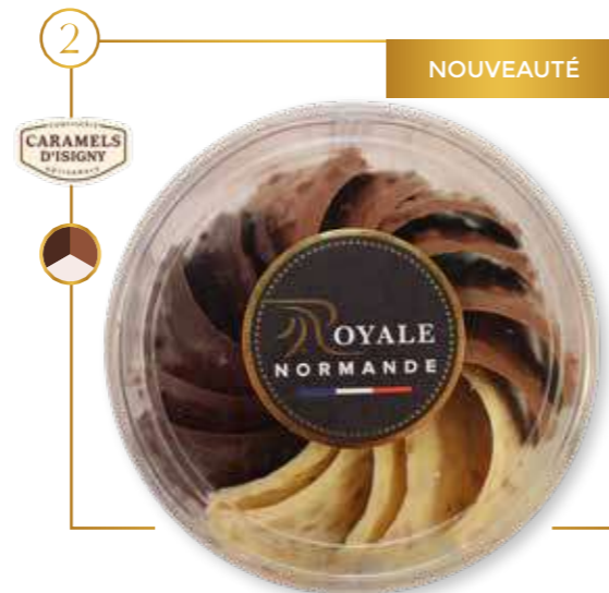
Éclats caramel d'Isigny