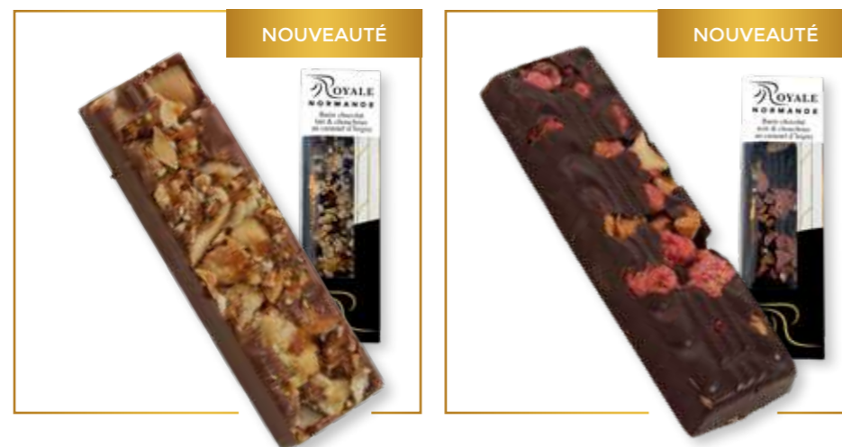
Barre chocolat lait & chouchous au caramel d'Isigny 20g x 24 – 348