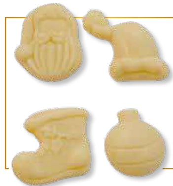
Chocolat blanc 4 sujets assortis 2kg - 560B 8kg - 560BPP2