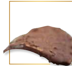
Aux grûés (éclats de cacao) 321