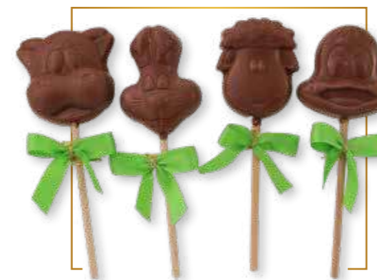
Chocolat lait sucettes animaux assortis 18g x 20 - S005