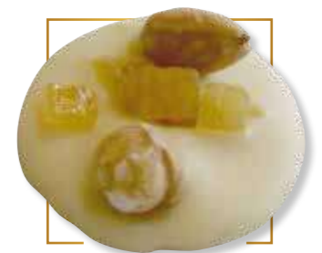
Chocolat blanc* 701B