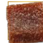
Fraise* PA 112