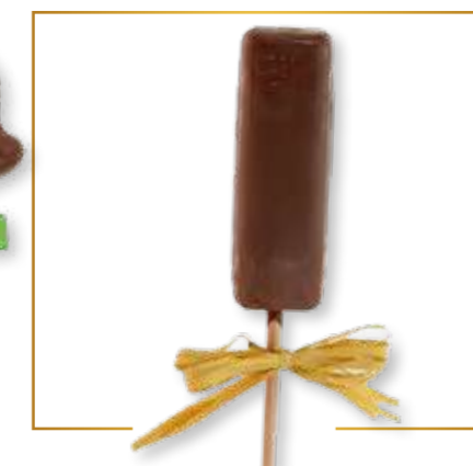
Sucettes de Guimauves enrobées chocolat lait 25g x 14 - S006