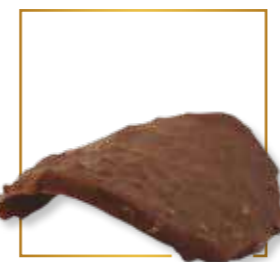
Feuillettine croustillante 322L