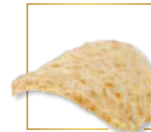
Feuillettine croustillante 322B