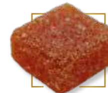
Abricot* PA 109