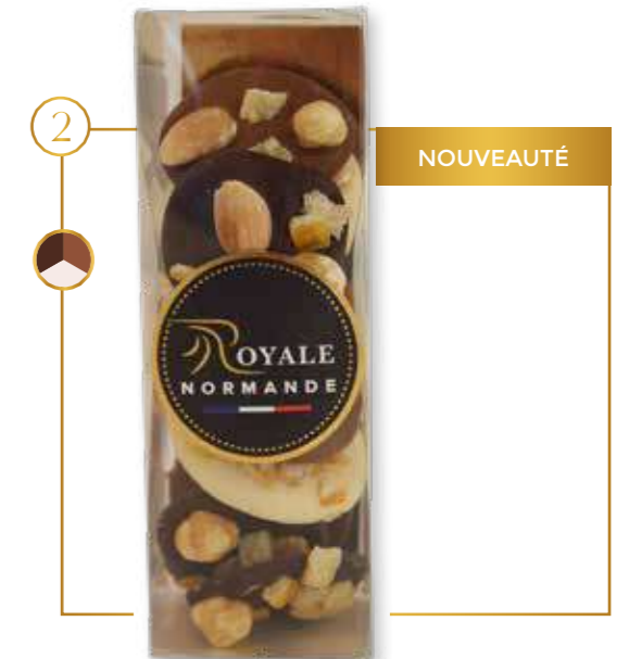
Assortiment lait, noir, blanc

1 AMANDES NOUVEAUTÉ Assortiment lait, blanc, noir Boîte 160g x 9 - 320AB3