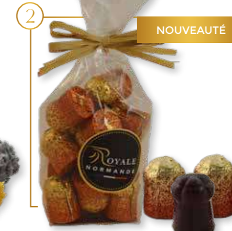
Bouchons chocolat noir & alcool calvados