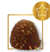
Dome praliné feuilletine NOUVEAUTÉ 105L2