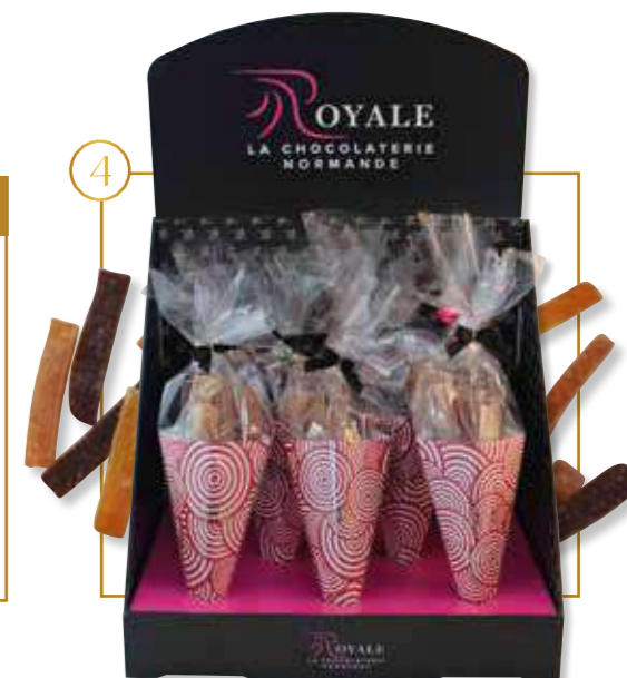
Cornet de pâtes de fruits frites