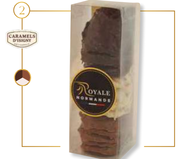
Éclats de caramel d'Isigny