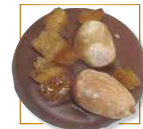
Chocolat lait* 701L

Chocolat lait Vrac - Carton 2kg - 701L Chocolat noir Vrac - Carton 2kg - 701N Chocolat blanc Vrac - Carton 2kg - 701B