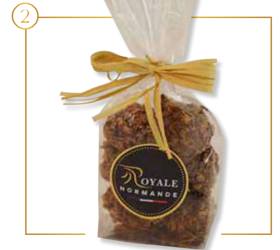
Praliné crêpe dentelle