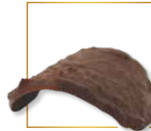
Feuillettine croustillante 322N