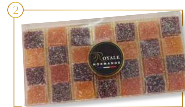
Coffret assortiment 4 parfums