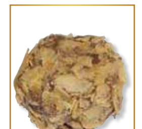
Praliné crêpe dentelle