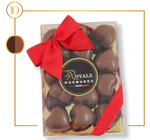
Coffret Cœurs Chocolat noir intense & chocolat lait praliné croustillant