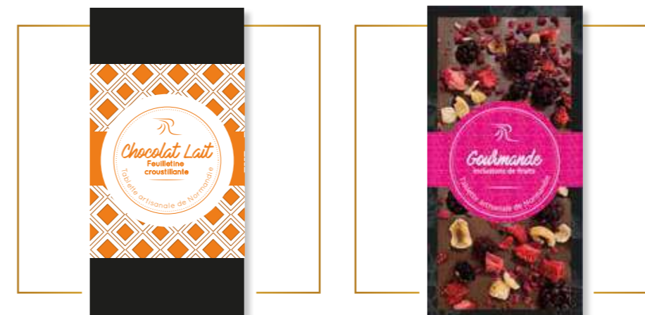
Chocolat lait feuillette croustillante x 12 – PP223