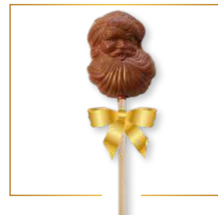
Chocolat lait père Noël 10g x 20 - S001