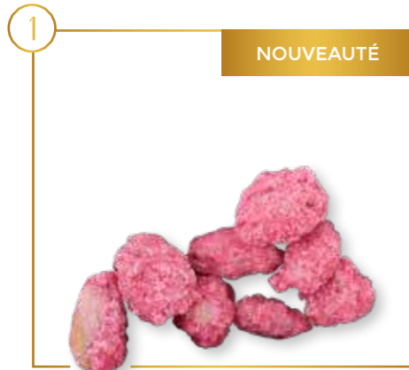
Chouchous amandes roses