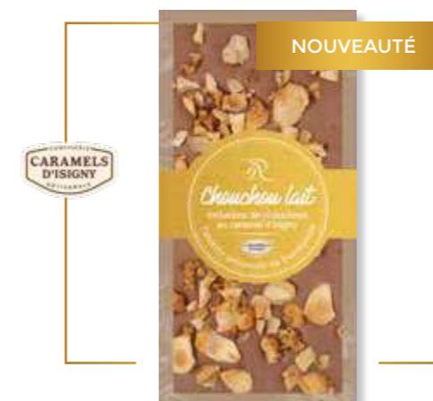
Chocolat lait & inclusions de chouchous au caramel d'Isigny 110g – x12 – PP247