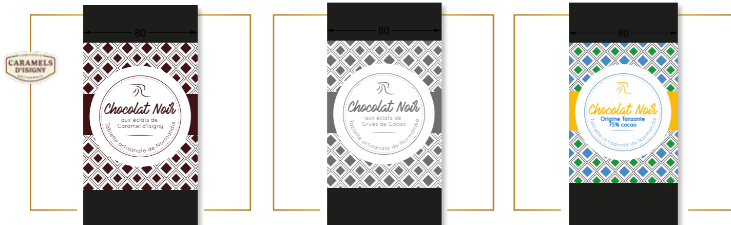
Chocolat noir aux éclats de caramel d'Isigny x 12 – PP211