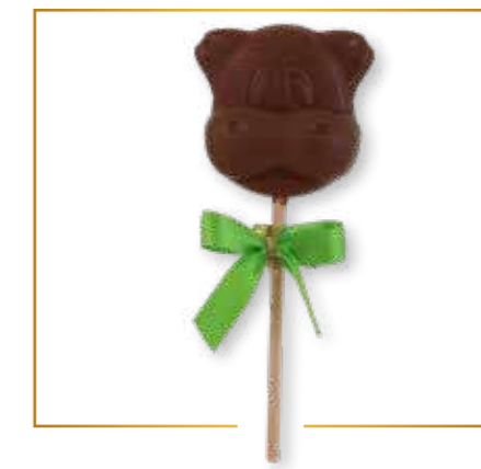
Chocolat lait vache 18g x 20 - S003