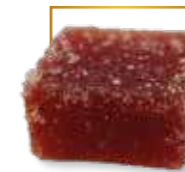
Pêche* PA 102