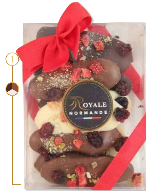
Coffret langues de chat assorties