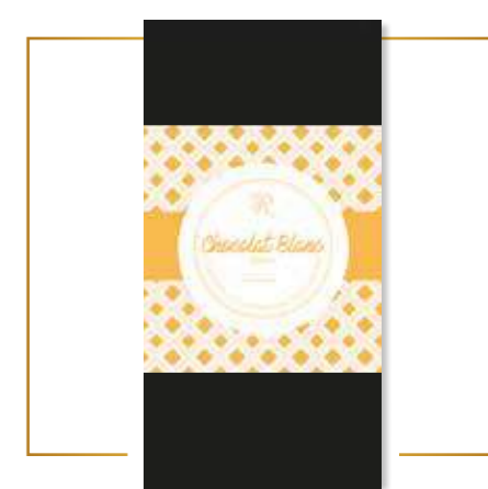
Chocolat blanc toute simple ! x 12 – PP221