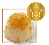
Dome praliné feuilletine NOUVEAUTÉ 105B2