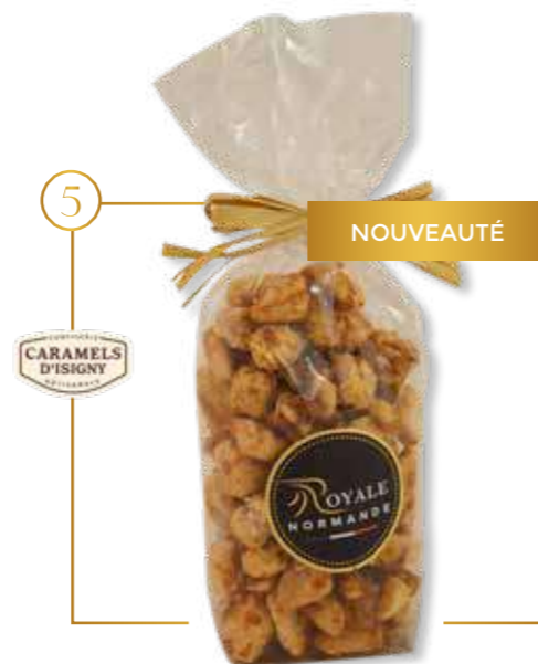
Praline au caramel d'Isigny