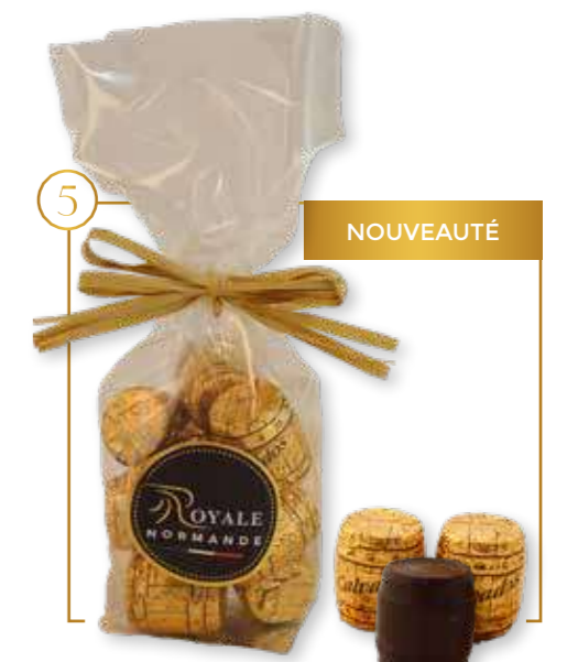
Tonneaux chocolat noir & alcool calvados