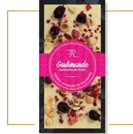
Chocolat blanc gourmande inclusions fruits x 12 – PP227