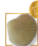
Demi coquillage NOUVEAUTÉ 1525BPP2