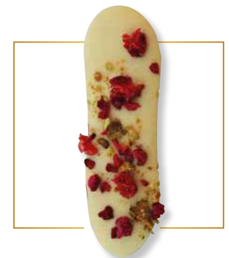
Chocolat blanc & inclusions fruits 190B