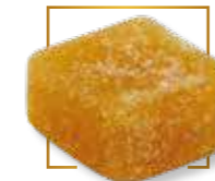
Ananas* PA 110