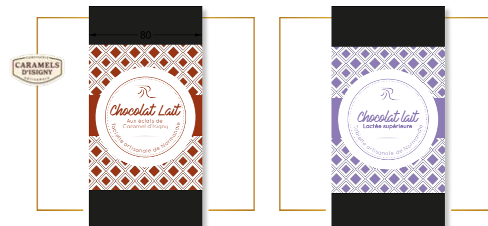
Chocolat lait aux éclats de caramel d'Isigny x 12 – PP210