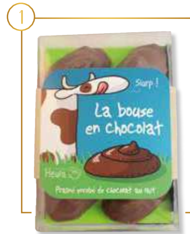
La véritable Bouse Normande Heula