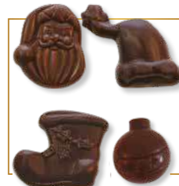
Fritures feuilletine croustillante chocolat noir 4 sujets assortis 2kg - 561N