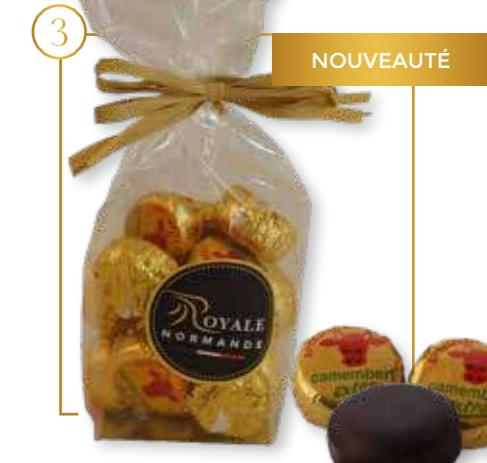
Camembert chocolat noir & alcool calvados