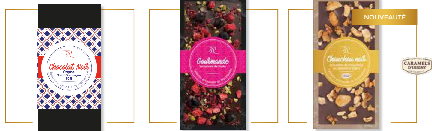
Chocolat noir origine St Domingue 70% x 12 – PP220