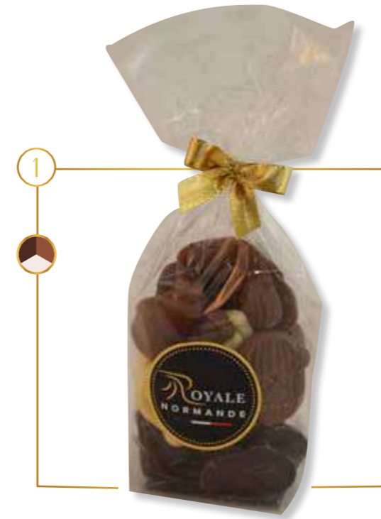
Assortiment fritures de Noël