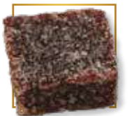
Cerise* PA 113

1 ASSORTIMENT 3 PARFUMS Sachet 150g x 12 PA100S CC