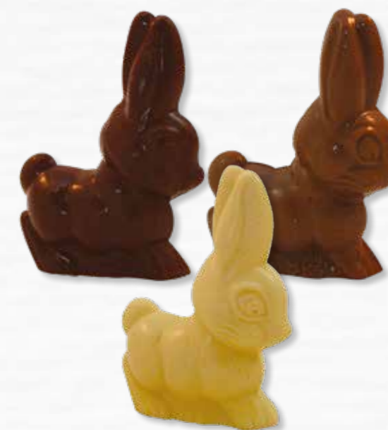
2 - Petits lapins