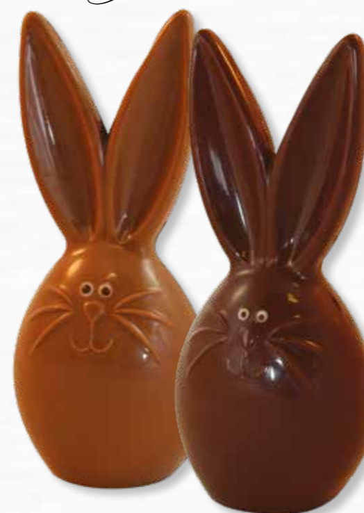
3 - Doudou lapinou