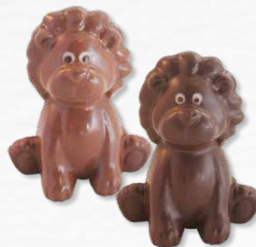
1 - Ludo le lion