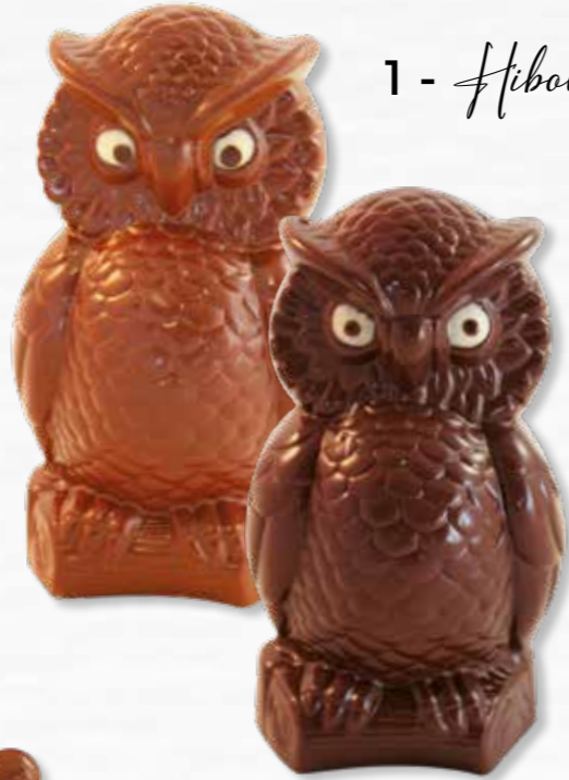
1 - Hibou le gribou