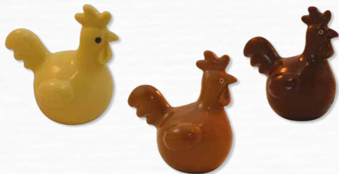
2 - Michel le coq