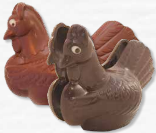
1 - Sidonie la poule